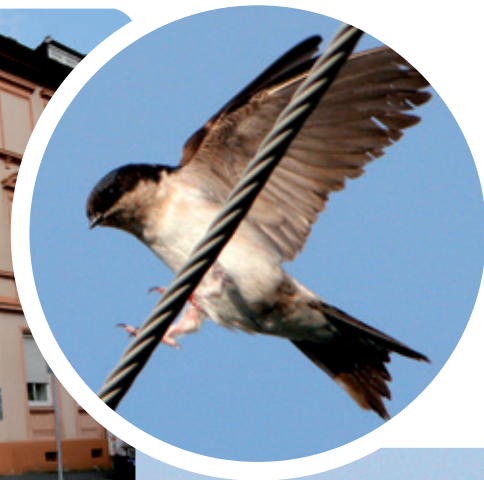
Text und Foto: Sabine Michael