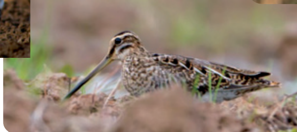
Fotos v.l.n.r.: Nilgans und Singschwan, Wasserralle, Bekassine, Teichhuhn